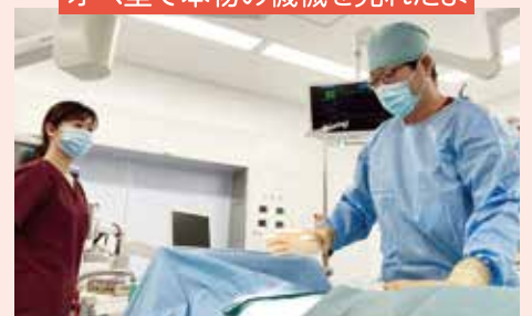
オペ室で本物の機械を見れたよ