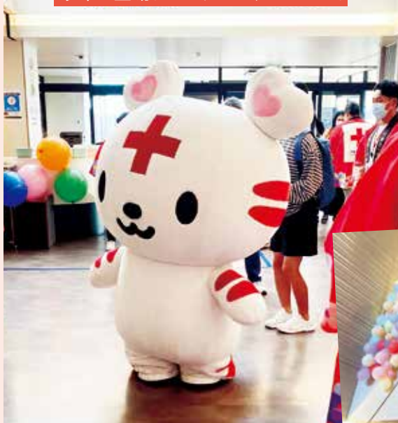
今年も登場！ハートラちゃんだガオ！